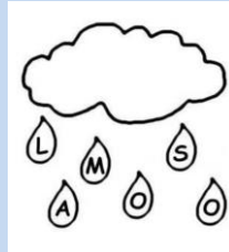
Tropfenrätsel Nr. 02