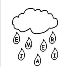
Tropfenrätsel Nr. 01

Hier regnet es Buchstaben, die man in die richtige Reihenfolge bringen muss, damit sie zusammen ein bekanntes Wort ergeben – nur welches? Hinweis: es handelt sich um biblische Begriffe. Und nun drei verschiedene Tropfenrätsel für euch!